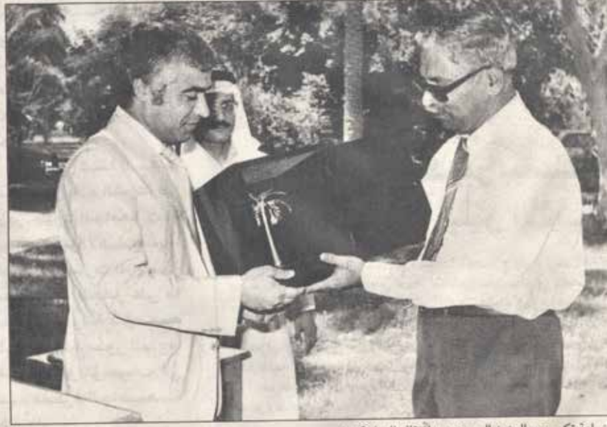
زراعة تكريم عبدالعزيز الحسن بعد انتقاله للعمل كسفير