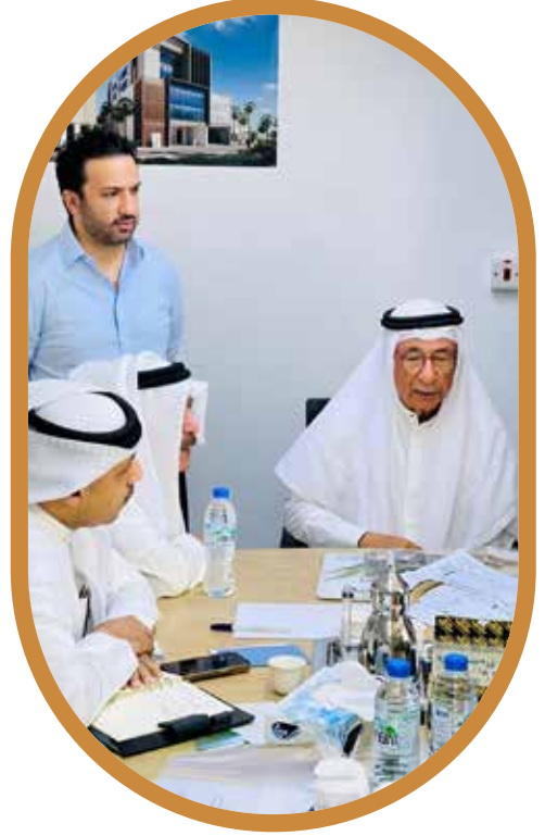
مشروع المبنى الجديد لجمعية البحرين الخيرية في مراحله النهائية