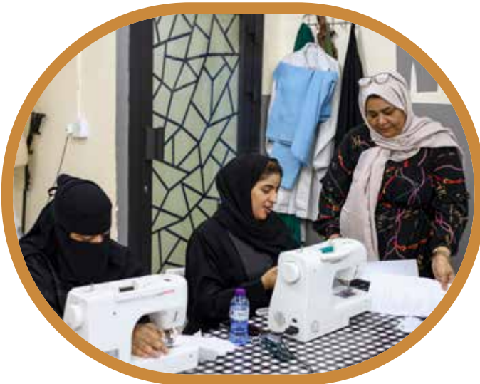
جمعية البحرين الخيرية تختتم دورة تدريبية في مجال الخياطة بنجاح