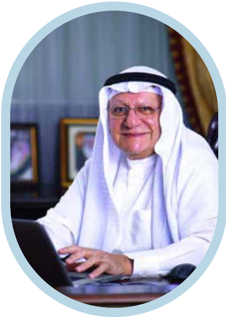
فاروق المؤيد... أثر لا يغيب