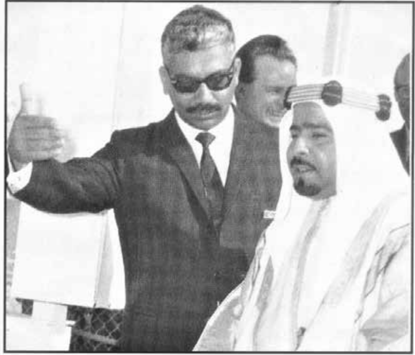
سمو الأمير الراحل يستمع الي شرح من السيد الحسن في أحد المعارض الزراعية

بعد التقاعد، لم ينزو عبدالعزيز، بل انخرط في العمل الاجتماعي والتوعوي. وكان قبل تقاعده من مؤسسي جمعية مكافحة التدخين عام