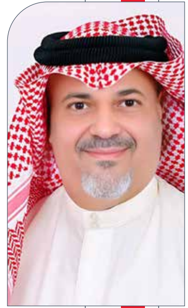
بقلم المهندس: إسماعيل الصراف

اليوم، ومع احتفال مملكة البحرين بيومها الوطني، يقف أبناؤها على أرض صلبة من الإنجازات الاقتصادية، ينظرون إلى المستقبل بثقة متجددة، مستعدين إلى قيادة حكيمة وضعت الوطن على مسار النمو المستدام والرخاء الدائم. إنها مسيرة مجد، تتواصل بإرادة لا تعرف المستحيل.