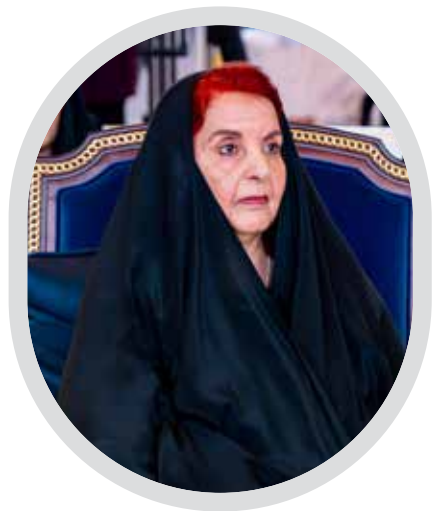
سمو الأميرة سبيكة الخطة الوطنية لنهوض المرأة البحرينية