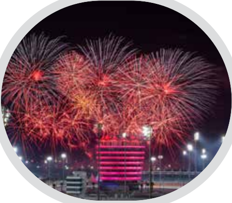
البحرين تتلألأ فرحاً... بالعيد الوطني زينة وطنية تضئ شوارع المملكة