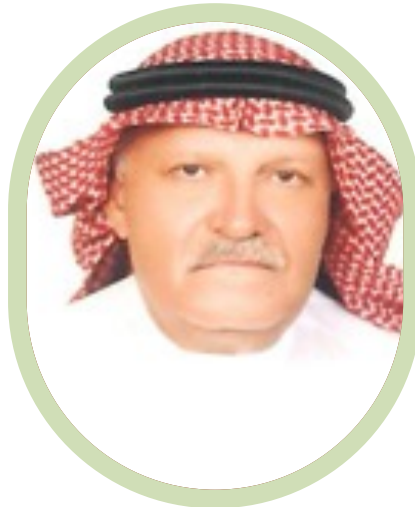
الأخلاق والعمل الخيري دعامة المجتمع البحريني