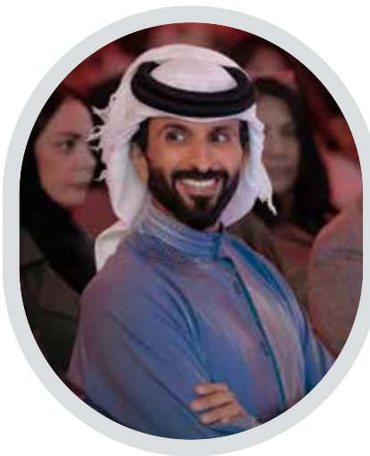
سمو الشيخ ناصر بن حمد البحرين.. منارة الحوار والسلام