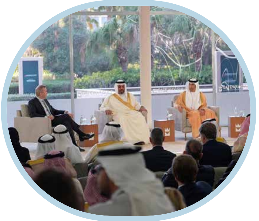
مؤتمر بوابة الخليج للاستثمار 2025