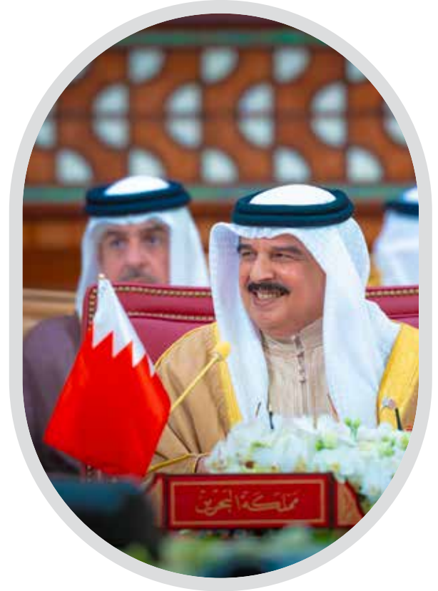
العدالة في فكر الملك حمد... رؤية تصنع الثقة وتؤسس للازدهار