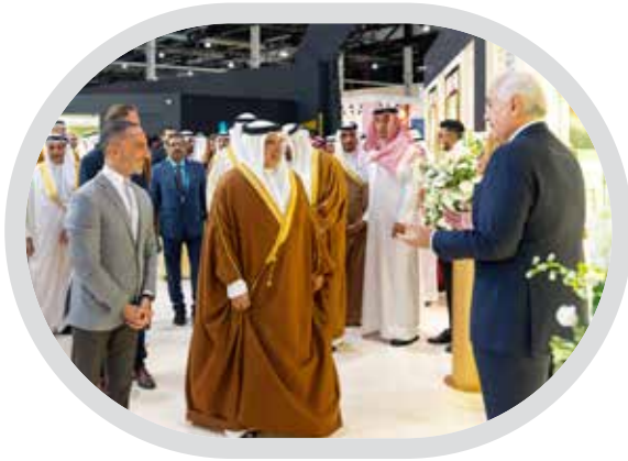
الجواهر العربية 2025: منصة تجمع 700 عارض وتحففي بإبداع بحريني