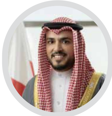
المؤسسة الملكية: رؤية ملكية للعمل الخيري