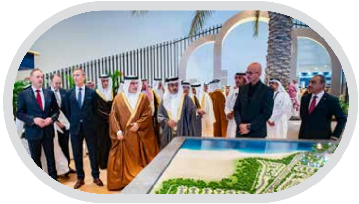
سيّتي سكيب البحرين 2025... منصة عقارية إقليمية تزدهر برعاية القيادة الرشيدة