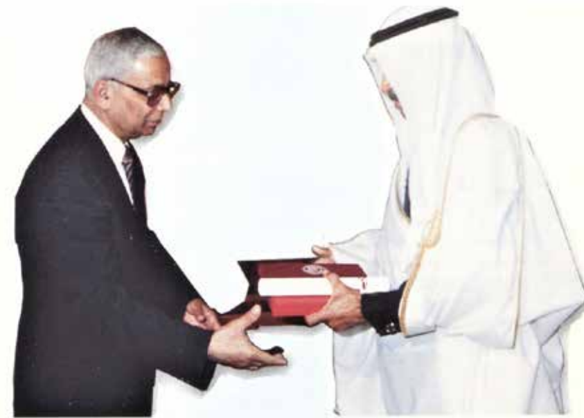
صاحب السمو رئيس الوزراء رحمه الله يسلم السيد عبدالعزيز الحسن جائزة الدولة التقديرية

١٩٥٤م، وعُيّن مفتشاً زراعياً في دائرة الزراعة بالبديع، ثم انتقل للعمل بدولة الكويت في وظيفة إدارية عام ١٩٥٥م. وعلى الرغم من الاستقرار المهني هناك، قرر العودة إلى البحرين عام