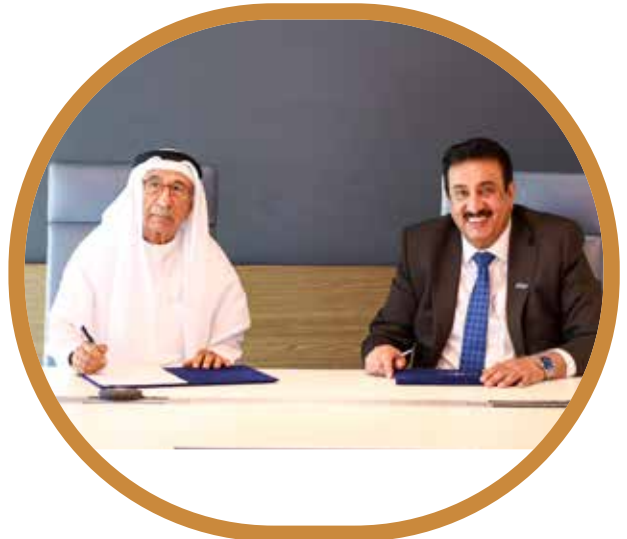
جمعية البحرين الخيرية ومعهد BIBF يوقعان اتفاقية لدعم طلبة البكالوريوس المتفوقين