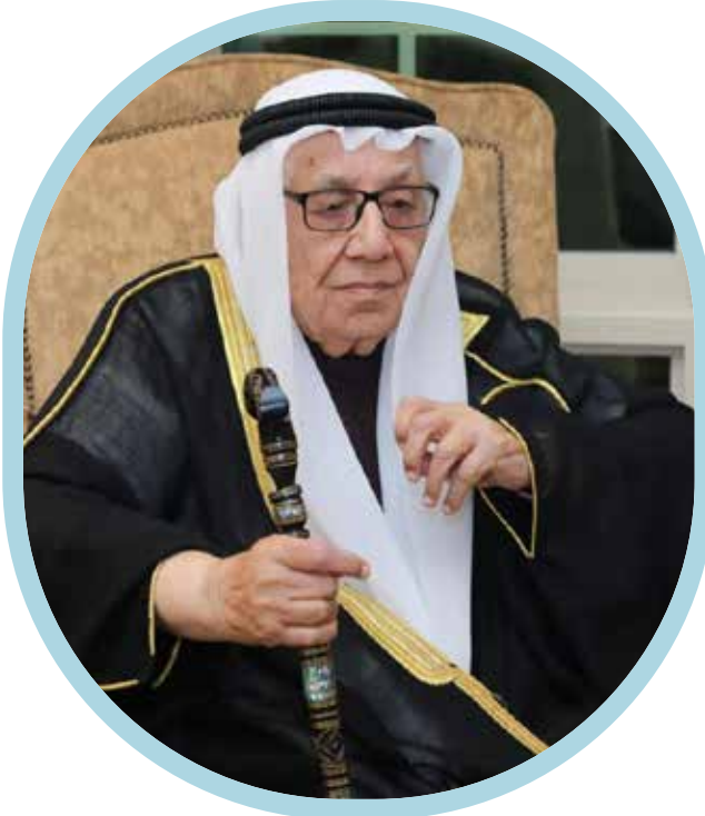
المرحوم سلمان بن عبدالوهاب الصباغ سفير البحرين إلى العالم