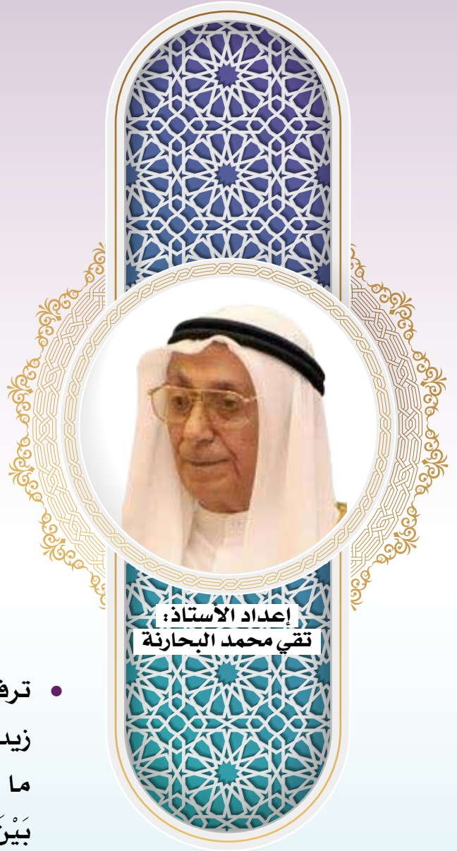
إعداد الأستاذ: تقي محمد البحارنة