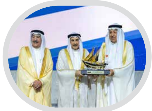
جائزة درع البلاد 2025: تكريم الريادة الاجتماعية