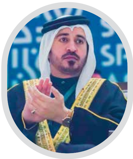
سمو الشيخ خالد بن حمد البحرين تتألق في الألعاب الآسيوية للشباب