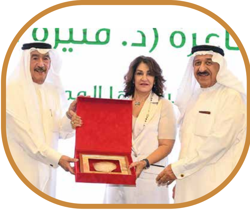
جائزة «مريم بنت جاسم كانو» تحتفي برموز نسائية متميزة