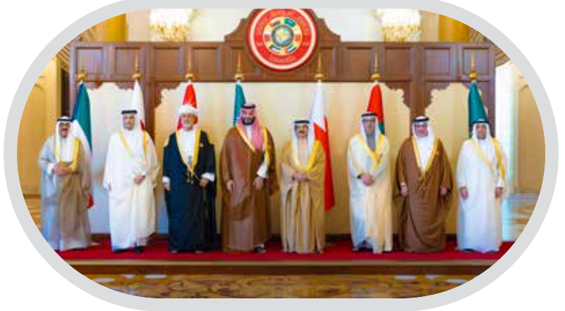
القمة الخليجية السادسة والأربعين: إعلان الصخير... خارطة طريق خليجية لتعميق الشراكة