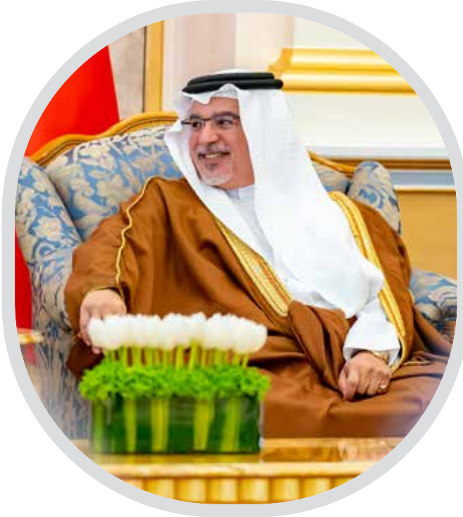
سمو رئيس الوزراء الكوادر الوطنية في صميم فكر رئيس الوزراء