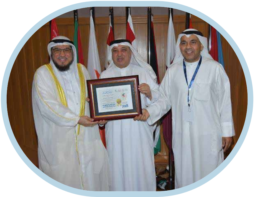
فضيلة الشيخ الدكتور مساعد محمد مندني