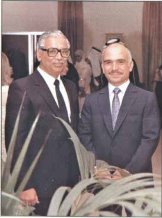
عبدالعزیز الحسن مع جلالة الملك حسين في إحدى المناسبات الرسمية