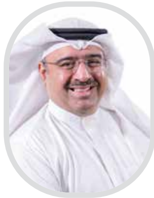
يوسف محمد إسماعيل الإعلامي الذي نحبّ يفارقنا وفي القلب حسرة