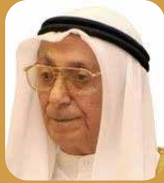
إعداد تقي محمد البحارنة