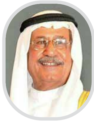
شعر حسن سلمان كمال عطاء

يشتمل برعايته السامية احتفال المجلس الأعلى للمرأة