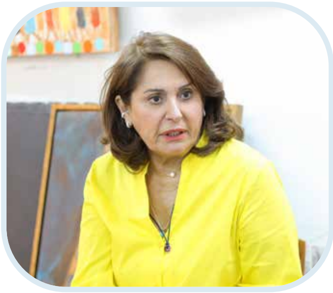
فائقة الحسن... ريشة على سبيل الفنّ