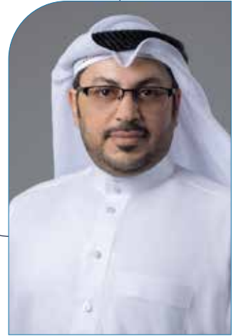
د. علي الصديقي رئيس لجنة الخبراء القانونيين بمنظمة العمل العربية

وتكريساً لذلك، تبنى المشرع مبدأ «اللامركزية» في حماية المسنين، عبر توزيع الأدوار وتكاملها في الوقت نفسه. فمن جانب، قام القانون بإنشاء «اللجنة الوطنية للمسنين» لتتولى وضع السياسات والخطط والإشراف